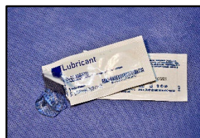
Lubricante soluble en agua